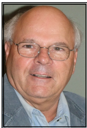
Par Michel Langlois, St-Jean-sur-Richelieu, Éditeur