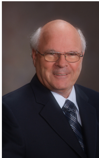
Par Michel Langlois, St-Jean-sur-Richelieu, Éditeur